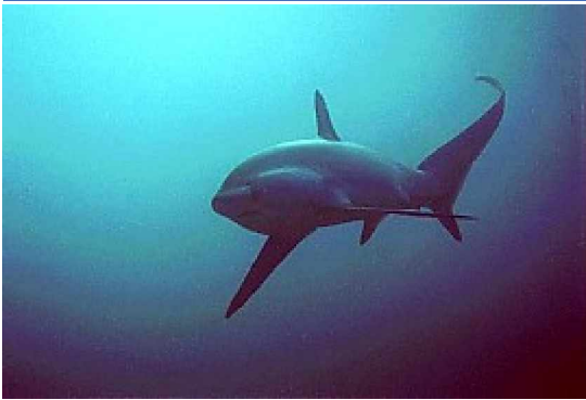
Fuchshai in Malapascua