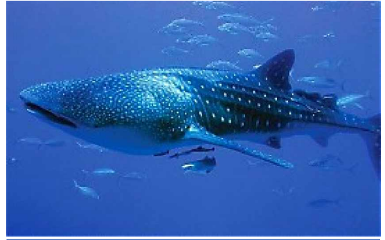
SY Philippine Siren