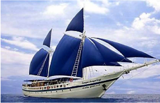
SY Siren - Thailand