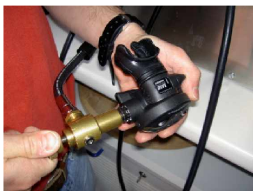
ggf. zweite Stufen eingestellt