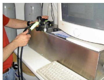
LA wird an die Prüfbank angeschlossen u. der Mitteldruck überprüft