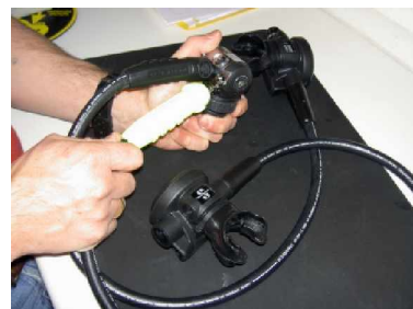
Oktopus wird montiert