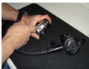
Blindstopfen werden abgeschraubt