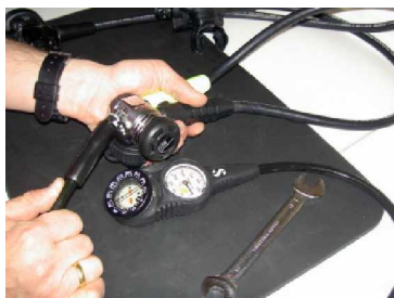
Konsole wird montiert