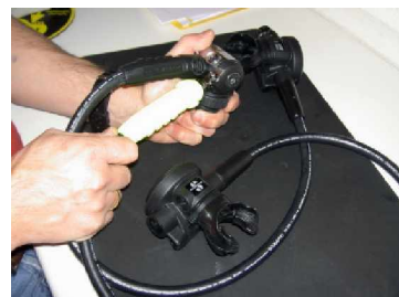
Inflatorschlauch wird montiert