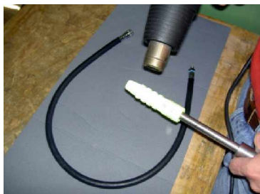
Knickschutz wird mit dem Heißluftfön erhitzt