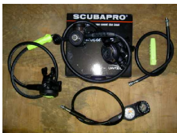
die Einzelteile wandern in die Werkstatt

Schauen Sie sich selbst doch einmal im Kurzdurchlauf an, was beim Kauf eines Lungenautomaten in der Werkstatt so fleißig geschraubt und eingestellt wird – da kommen ganz schnell 30 Minuten zusammen!