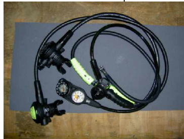
jetzt erst ist er tauchfertig!!!